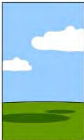
プロジェクトの書類