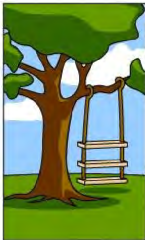
顧客が説明した要件