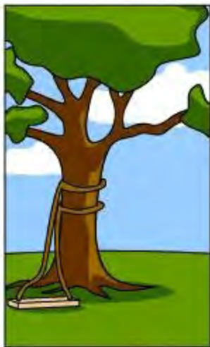
プログラマのコード