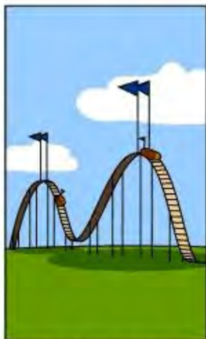
顧客への請求金額