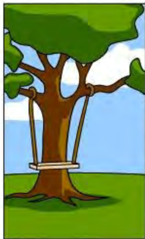
プロジェクトリーダーの理解