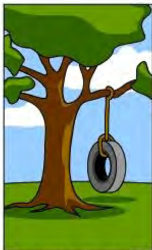
顧客が本当に必要 だった物