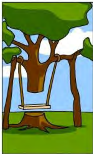
アナリストのデザイン